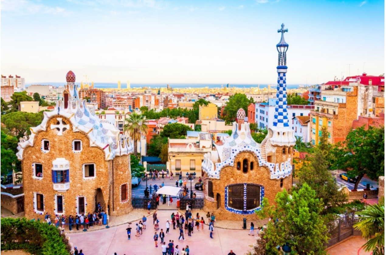
※奎爾公園，已於 1984 年被聯合國教科文組織列為世界遺產 UNESCO

跟公共設施主體便中止了社區計畫，活潑有趣的設計，宛如一個夢幻童話世界，帶給人歡樂。